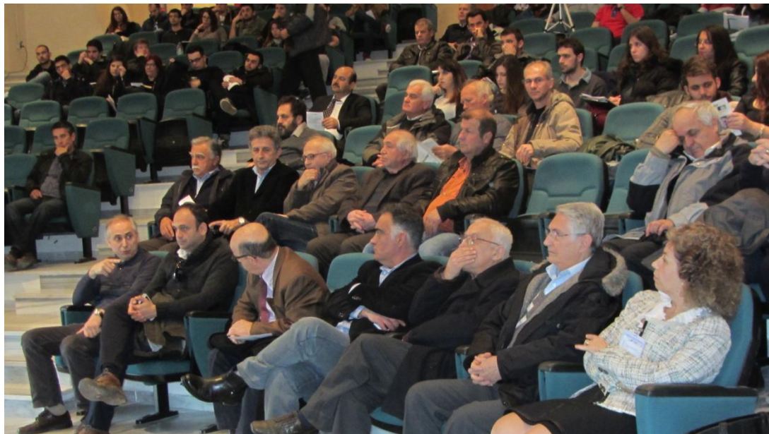
Άποψη του ακροατηρίου