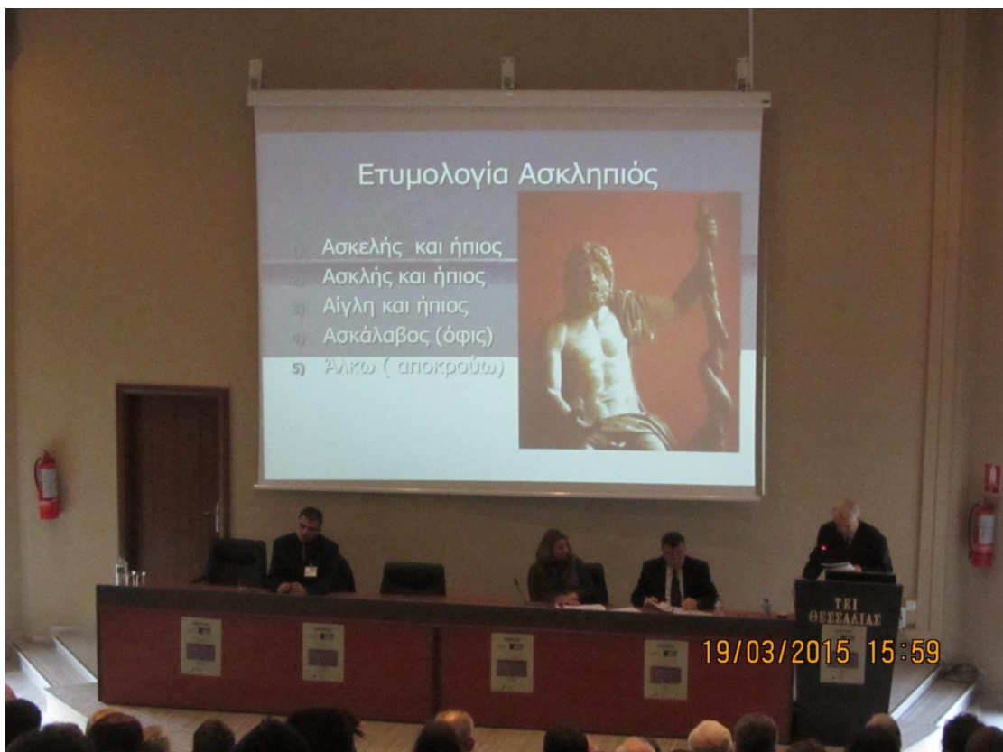
Η εισήγηση του κ. Ζαφείρη