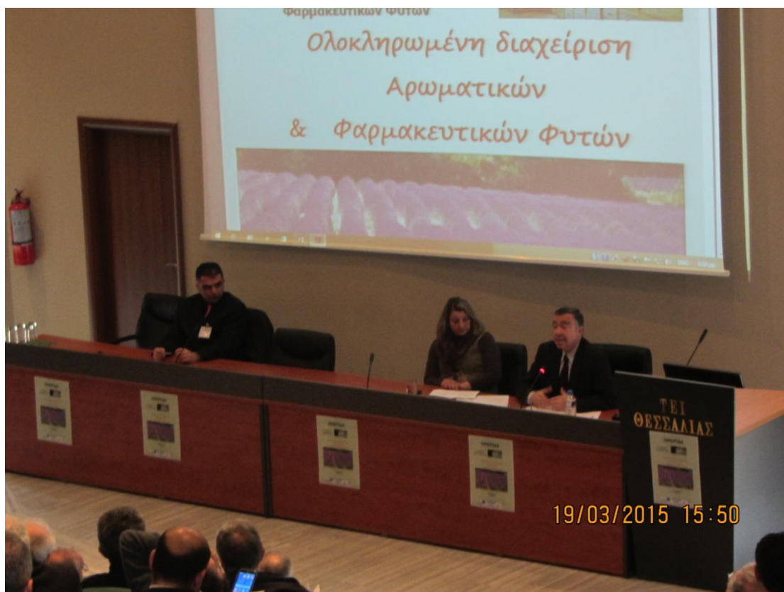
Χαιρετισμός του προεδρεύοντος κ. Παπαχατζή