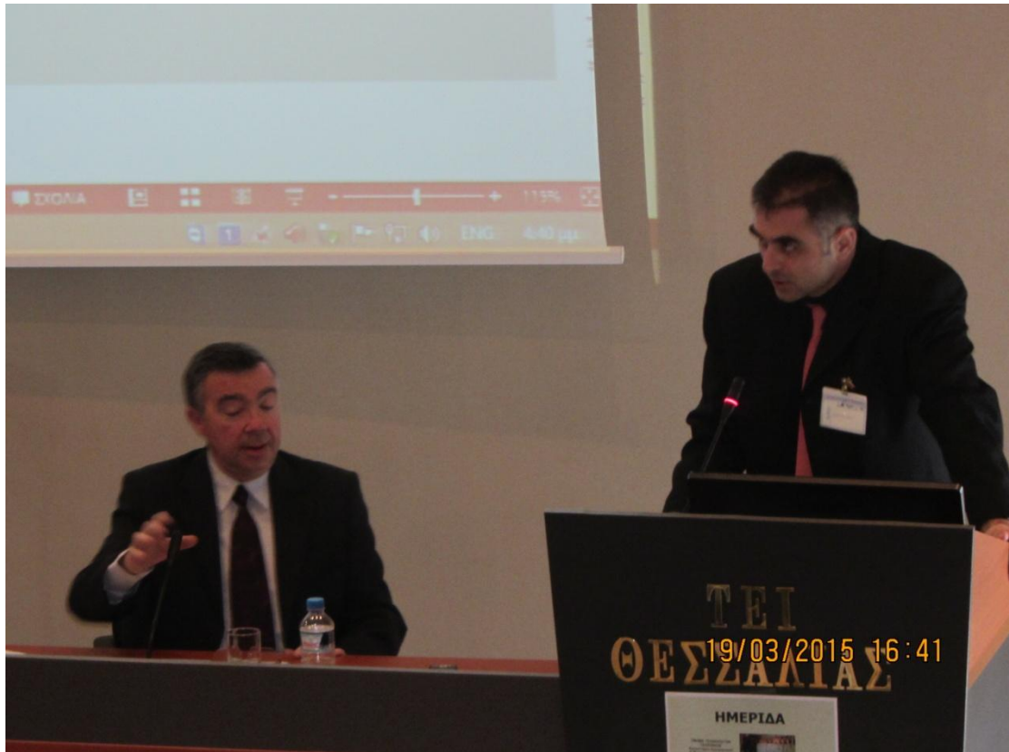
Από την εισήγηση του Γεωπόνου κ. Μακκά