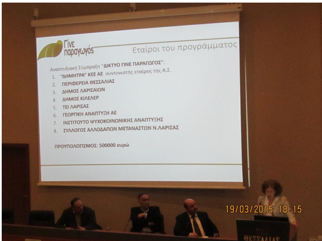
Παρουσίαση του προγράμματος <<Γίνε Παραγωγός>>.