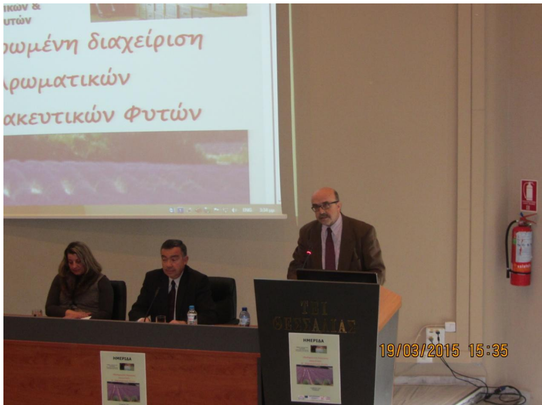
Χαιρετισμός του Προέδρου του ΤΕΙ κ. Γούλα