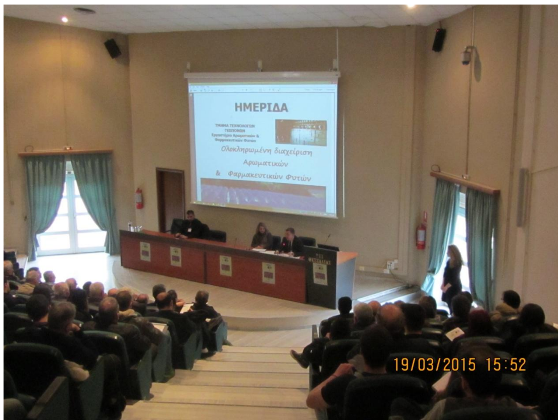
Γενική άποψη του αμφιθεάτρου