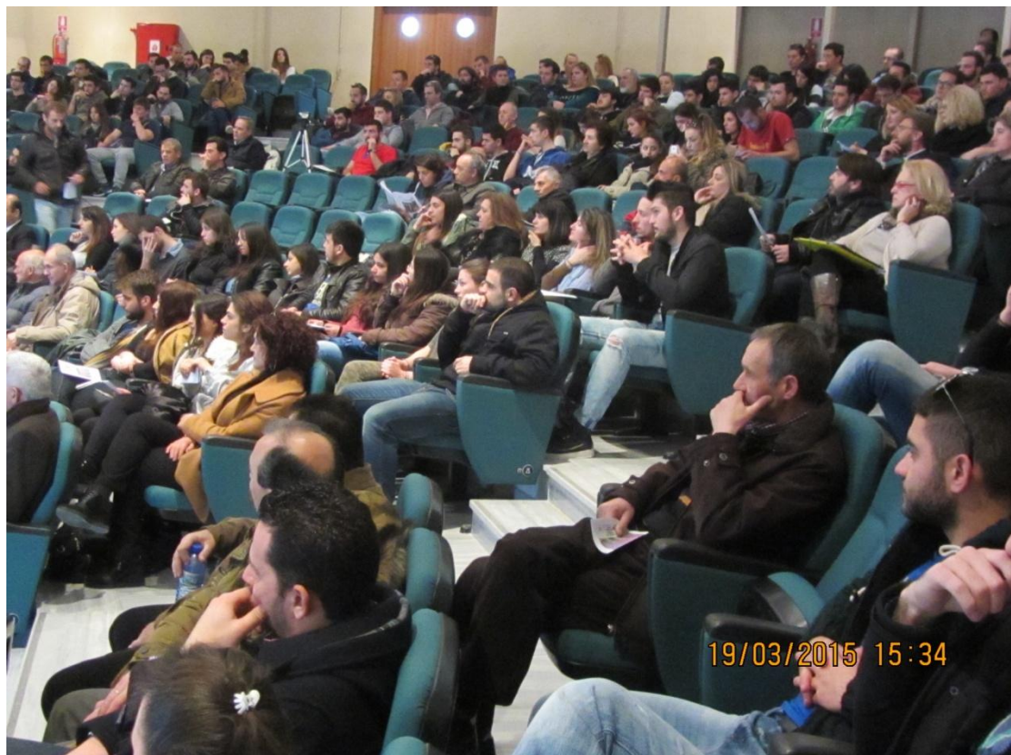
Γενικά άποψη του ακροατηρίου